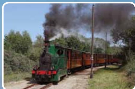
↑ Historische trein van de eilanden (RTM)

Ga naar: www.geschiedenisvanzuidholland.nl www.vvngoeree-overflakkee.nl www.erfgoedlijngo.nl www.streekarchiefgo.nl www.goeree-overflakkee.nl