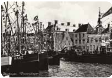
↑ Collectie Dorine van Hoogstraten