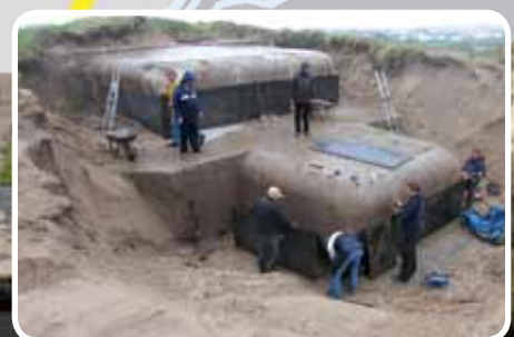
Herstel van een bunker door vrijwilligers