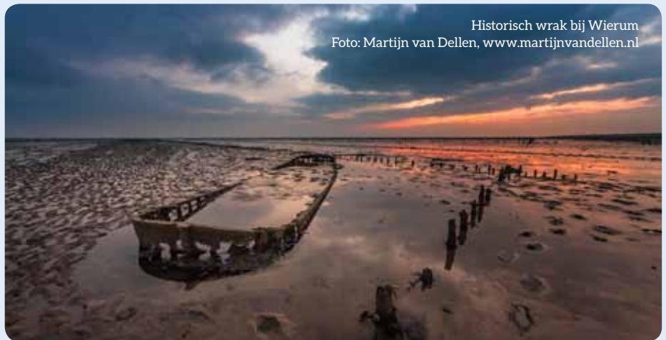
Historisch wrak bij Wierum

Eeuwenlang verdwenen er complete dorpen langs de Noord-Nederlandse kust. Overstromingen, kusterosie en geulverplaatsingen waren de belangrijkste oorzaken. Dijken braken ook geregeld door. Veel van die verdrinken dorpen liggen op de bodem van Eems en Dollard. Hier is nog weinig onderzoek naar gedaan.