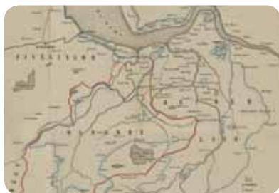
↑ Kaart van G. Acker Stratingh uit 1854 met de verdrinken dorpen langs de Eems en in de Dollard

Om deze schatkamer te beschermen moet ook het buitendijkse erfgoed meer gewicht krijgen bij ruimtelijke plannen van zowel Rijk, provincies als gemeenten. Door ingrepen in het buitendijkse gebied kunnen archeologische, cultuurhistorische en landschappelijke waarden immers verloren gaan. Vooral binnen gemeenten is veel winst te behalen door deze waarden te verankeren in hun erfgoedbeleid. Daarvoor moet je eerst wel weten wat er is, waar het ligt en welke waarde het heeft.