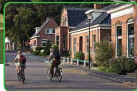
↑ Fietsers op de Torenweg in Warffum

Het project 'Terpen- en wierdenland, een verhaal in ontwikkeling' gefinancierd door het Waddenfonds, is in het leven geroepen om samen met bewoners van de Waddenregio de rijke geschiedenis van het terpen- en wierdenland weer boven water te halen. Dit wordt gedaan door, samen met diverse