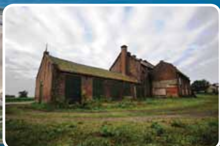
↑ Oude Cichoreifabriek, een monument