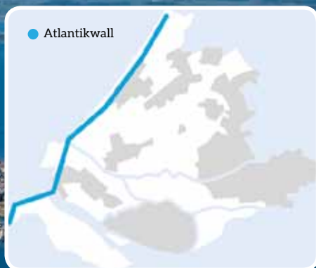
↑ Over Goeree-Overflakkee loop ook de Erfgoedlijn Atlantikwall

Ooit verbonden de havenkanalen op het eiland alle dorpen en loswallen met de zee. Tegenwoordig zijn ze niet meer met 'groot water' verbonden, wel grotendeels met elkaar. Vanaf de Stellendamse haven vaart u met fluisterboten en trapkayaks het bijzondere natuurgebied in. De route biedt diverse afmeermogelijkheden. Informatie over de verhuur: +31 187 491 376 www.wapenvanstellendam.nl .