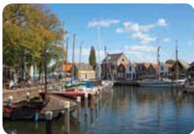
↑ De historische haven van Middelharnis

In de geschiedenis van Goeree-Overflakkee speelt water een belangrijke rol. Die geschiedenis is zichtbaar gemaakt op de Erfgoedkaart Goeree-Overflakkee. Gratis te verkrijgen bij de VVV en de musea. Zie ook: www.geschiedenisvanzuidholland.nl/eropuit/erfgoedkaart-goeree-overflakkee